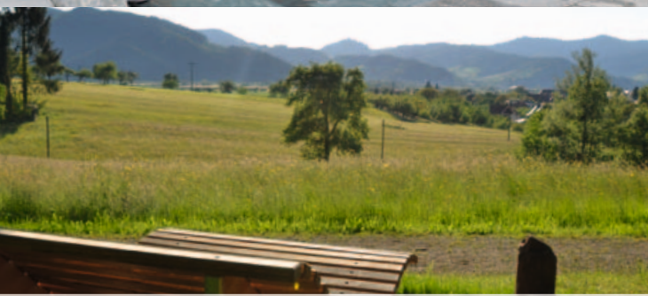
Waldsofa auf der Gehrmatt mit Blick bis zur Geroldseck.