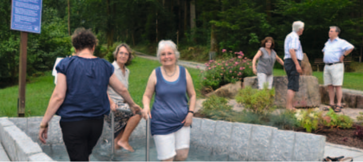
Kneipptretanlage im »Herrenholz«.