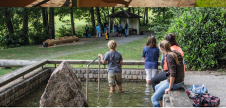
Wassertretstelle in Hinterhambach , direkt am Bachwegle.