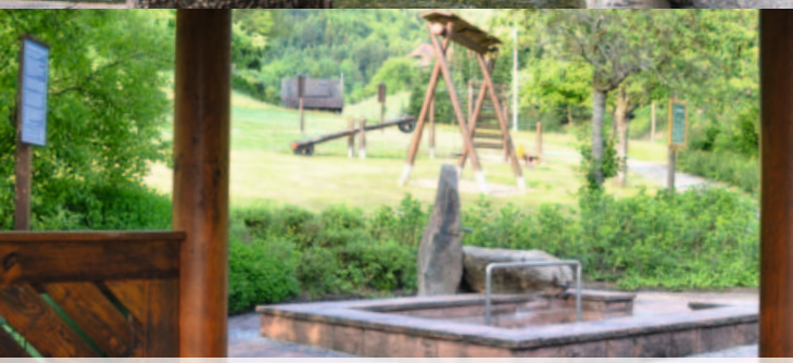
Pavillon, Wassertretstelle, Spielplatz in Oberentersbach .