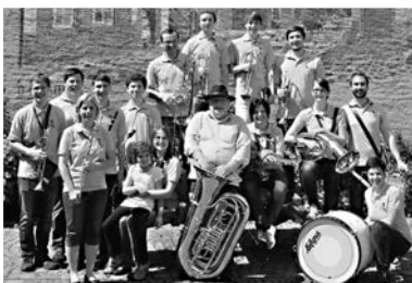
Die „Minipäpers“ live beim Städtlemarkt am 5. Mai, in Zell a. H.

Die Besucher des Städtlemarkts freuen sich über Tütchen gefüllt mit Samen bunter Sommerblumen. Die verteilen Mitglieder des Imker-Vereins solange der Vorrat reicht und informieren über blütenreiche Insektenbeete, den Schutz der Artenvielfalt und Ökosysteme – das beginnt bereits im eigenen Garten. Die Aktion „blütenreiches Zell am Harmersbach“ findet im Rahmen des Nachhaltigkeits-Netzwerks Baden-Württemberg statt. Bei einem Wochenmarkt ist Nachhaltigkeit natürlich immer Thema. Selbstverständlich auch bei der Wahl der Einkaufsverhältnisse. Deshalb sind Einkaufskorb und Stofftasche beim Städtlemarkt die beste Lösung. Fällt der Einkauf größer aus, als gedacht stellt das Nachhaltigkeits-Netzwerk beim Städtlemarkt am 5. Mai kostenlose Papiertüten – sogenannte HeldeN-Tütle – zur Verfügung. Die haben die rund 30 Marktbestücker bereits ab 7 Uhr parat, wenn der Städtlemarkt öffnet. Dann sind die Marktstände auf dem Kanzleiplatz mit unterschiedlichen Produkten, auch direkt vom Bauernhof gefüllt. Selbst hergestellte Nudeln, Bauernbrot, Honig, Butter, Wurst, Käse, Schnäpse, Liköre, Blumen, Setzlinge und vieles mehr wechseln den Besitzer – lokal, regional, nachhaltig.